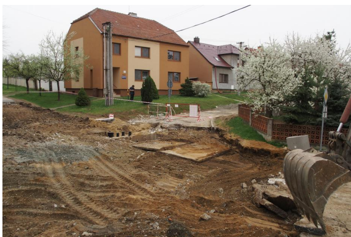
křižovatka u kapličky