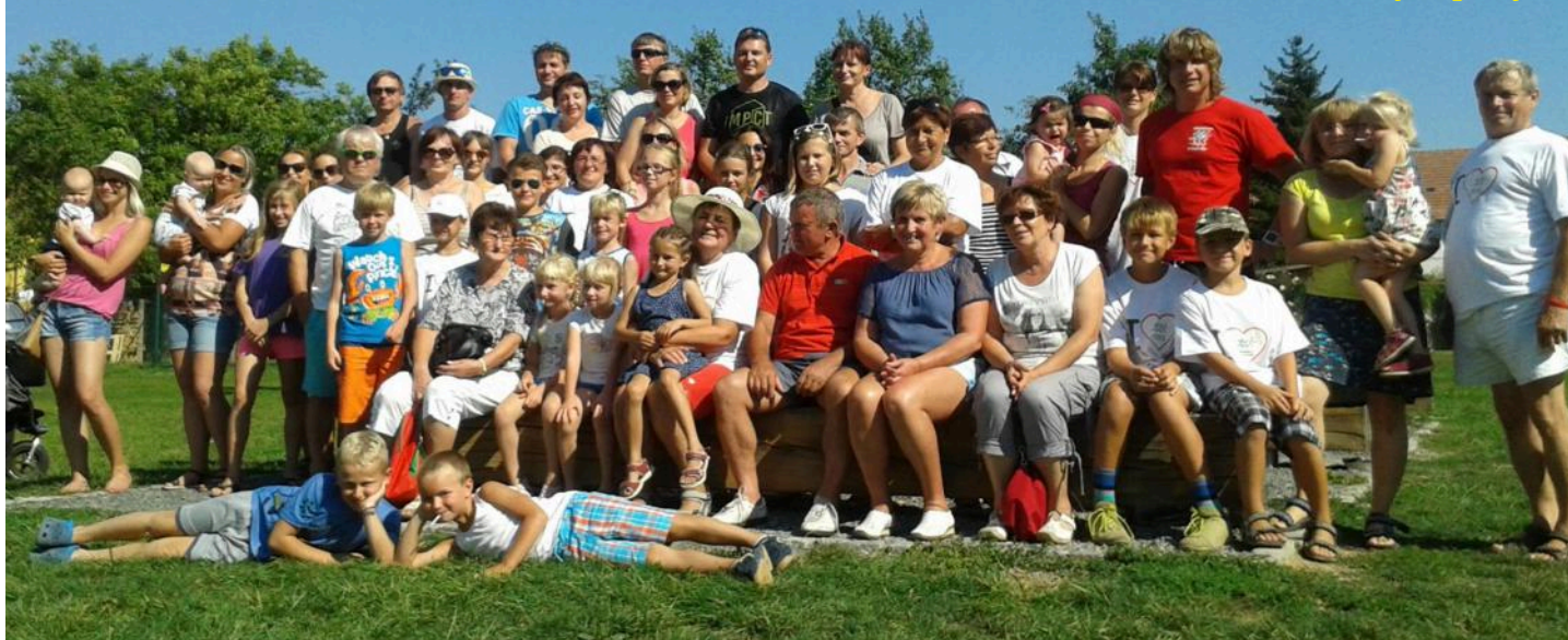
Vnorovy v pohybu

Všem zúčastněným moc děkujeme za projevenou přízeň a chuť dělat něco pro své zdraví. Těšíme se na další akci.