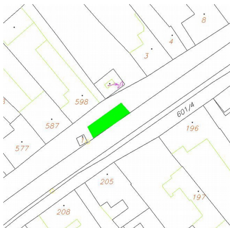
Liděrovice, zpevněná plocha u zvonice