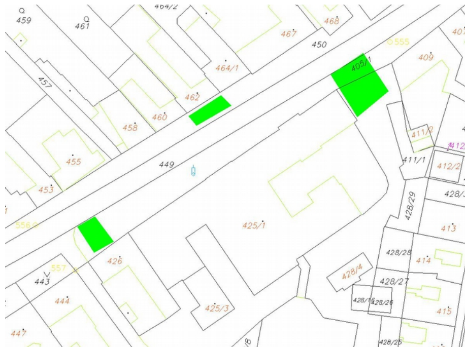
Zpevněné plochy u ZŠ Vnorovy v termínu konání běhu Vnorovská desítka