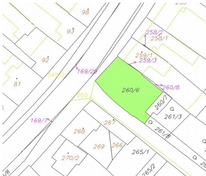
prodejná plocha v ul. Smetkova