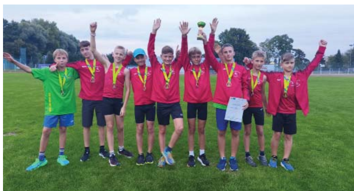
Finále Jihomoravského kraje - družstvo mladších žáků