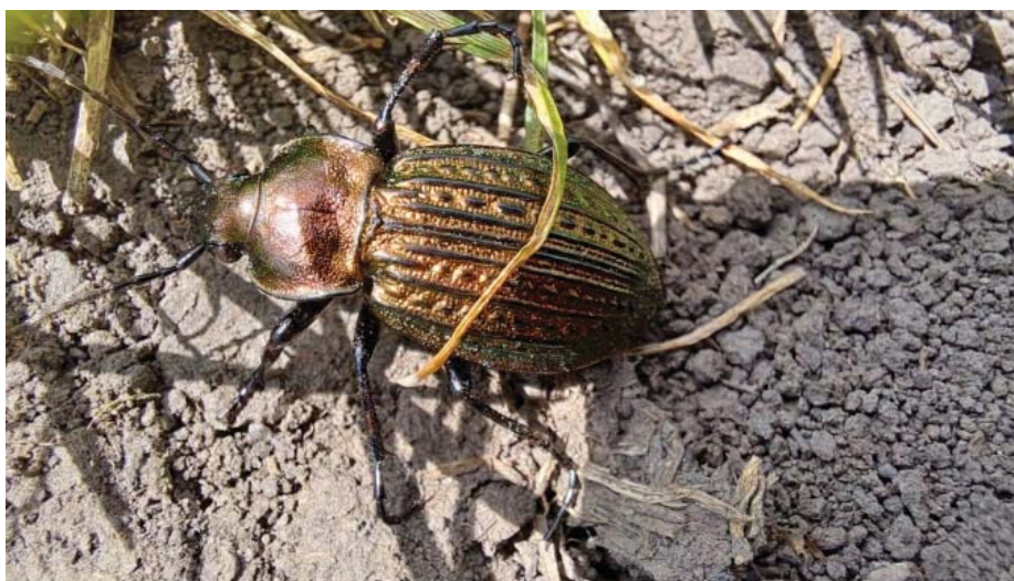
Pancíř jako z bronzu. Detailní pohled na střevlíka, jednoho z mnoha obyvatel Veselska