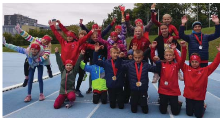
Grandfinále Zlaté ligy atletických přípravků v Brně