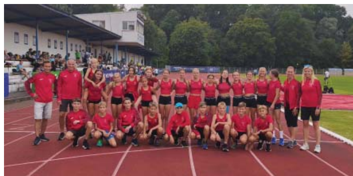
Finále Jihomoravského kraje mladšího žactva