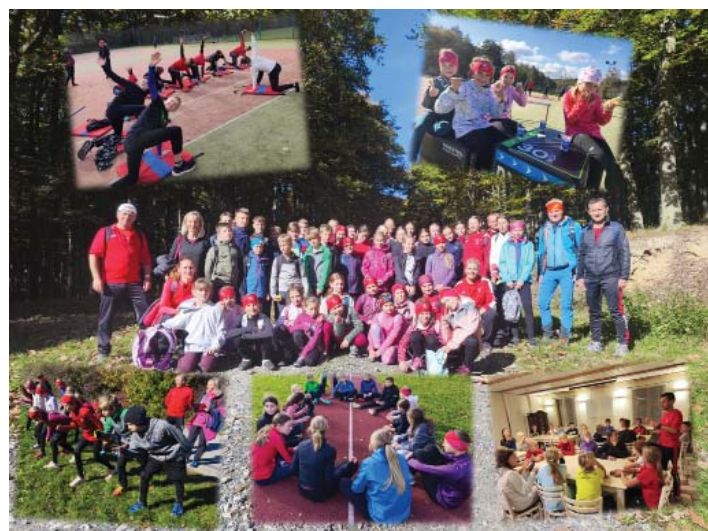
Soustředění Atletického klubu Vnorovy v Osvětimanech

Domácí stadion hostil během roku několik sportovních akcí. V květnu se zde konal mítink Zlaté ligy atletických přípravků, kde naši závodníci získali v konkurenci 119 dětí celkem 33 medailí. Krátce poté stadion zaplnilo 103 dětí při Atletickém čtyřboji, který doprovodil tradiční Štafetový maraton. Velký zájem zaznamenal také červnový Olympij-